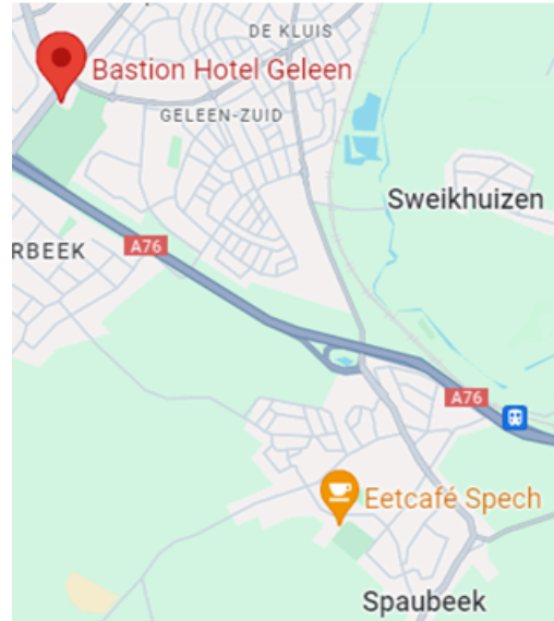
Bastion Hotel, Geleen