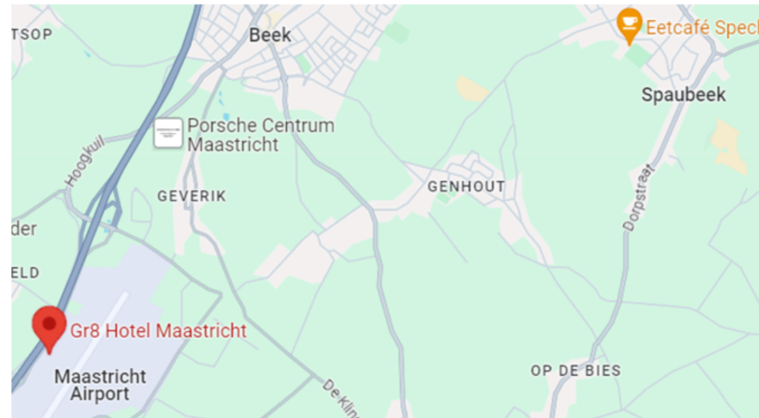
Gr8 hotel Maastricht